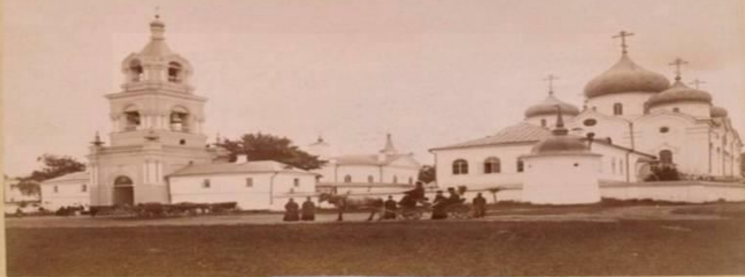
Ообщій видъ Трицянъ.

С Троицким монастырём связано одно из самых драматичных событий междоусобных войн в Московской Руси. В 1442 году в монастыре у гроба Сергия состоялось примирение Василия 2 с двоюродным братом Дмитрием Шамьяком, которым закончились долгие годы междоусобицы. Однако спустя два года Дмитрий нарушил данную клятву; люди Шемяки схватили Василия, молившегося у гроба Сергия, и отправили под конвоем в Москву, где спустя два дня Василий был ослеплён и сослан в Углич. Духовенство Троицкого монастыря осудило действия Дмитрия Шемяки освобождённый из заточения Василий II в 1450—1462 годах дал монастырю ряд жалованных грамот.